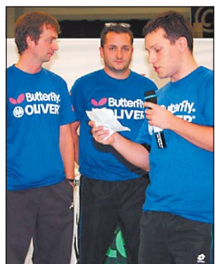
Für die Organisatoren gab es viel Lob von allen Seiten.

kommen. Das entschädigt für die harte Arbeit im Vorfeld«, sagte Frenkel. Überrascht habe ihn vor allem die hohe Teilnehmerzahl. »Da wir das Turnier bereits unter der Woche starten mussten, hatten wir befürchtet, dass das einige Spieler abhalten wird, anzureisen«, erklärte der Organisator. Doch diese Vermutung bestätigte sich nicht. Auch die Teams aus dem Ausland ließen sich die WM nicht entgehen. Die Kanadier zum Beispiel hatten sich eine gesamte Woche frei genommen und kamen schon am Dienstag am Flughafen in Hannover an.