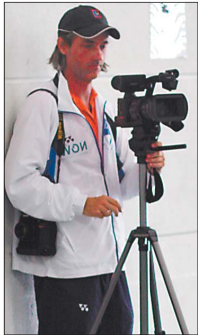
Film ab: Am Spielfeldrand wurde für die Racketlon-Homepage gedreht.